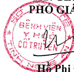
Hồ Phi Đông